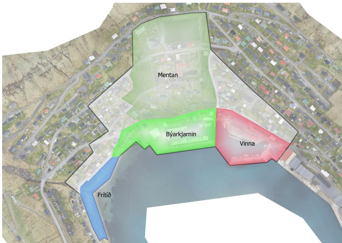
Kort frá kappingarskránni, ið sýnir høvuðseindir í miðbýnum